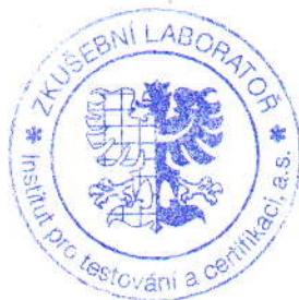
Doc. Ing. Vladimír Klepal, CSc. vedoucí zkušební laboratoře

Objednavatel: PRAGOELAST spol. s r.o. IČ: 62954610 Adresa: Na Cikánce 2 153 02 Praha 5 - Radotín Vzorek: Pryžový kompozit na bázi druhotných surovin: GR 850 FS Zadání: Hodnocení technických parametrů viz. str. 2 Datum přijetí vzorku: 4. 3. 2009 Vypracoval: Miroslava Špendlíková Místo a datum vydání: Zlín, 1. 4. 2009